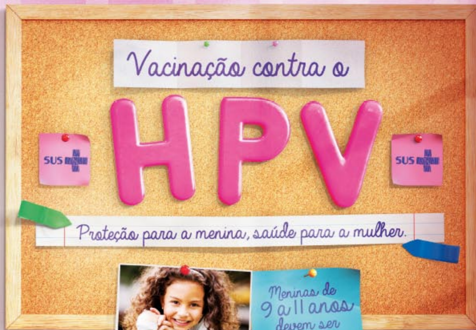
CRONOGRAMA CAMPANHA HPV - 2015 EM PARAGUAÇU PAULISTA