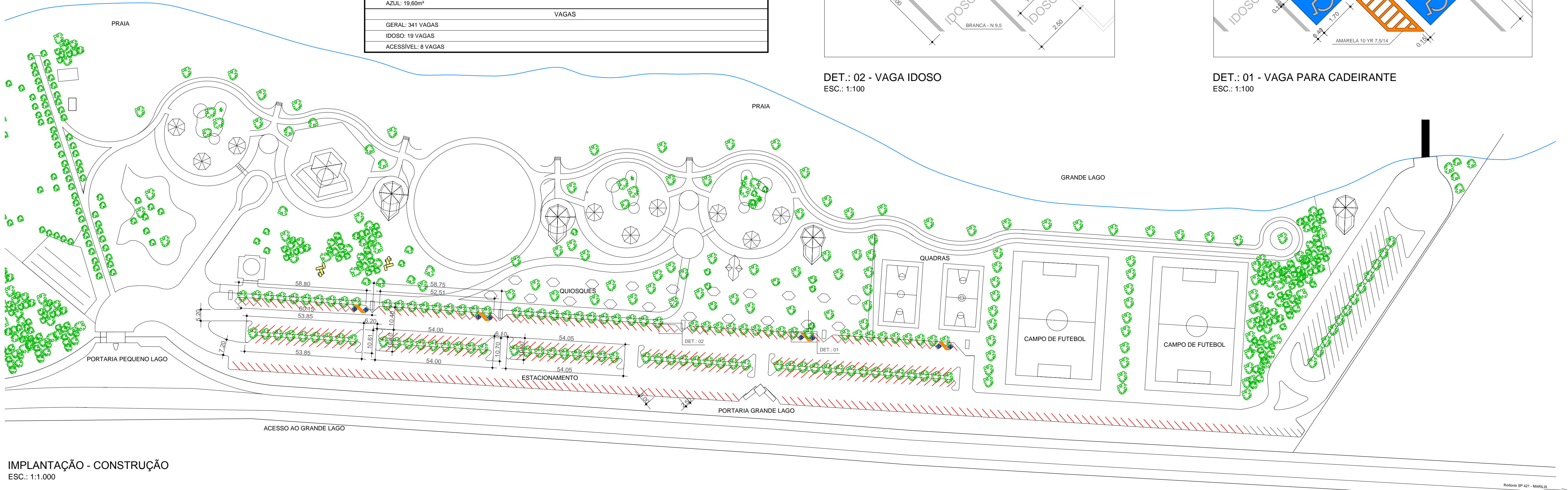
IMPLANTAÇÃO - CONSTRUÇÃO ESC.: 1:1.000