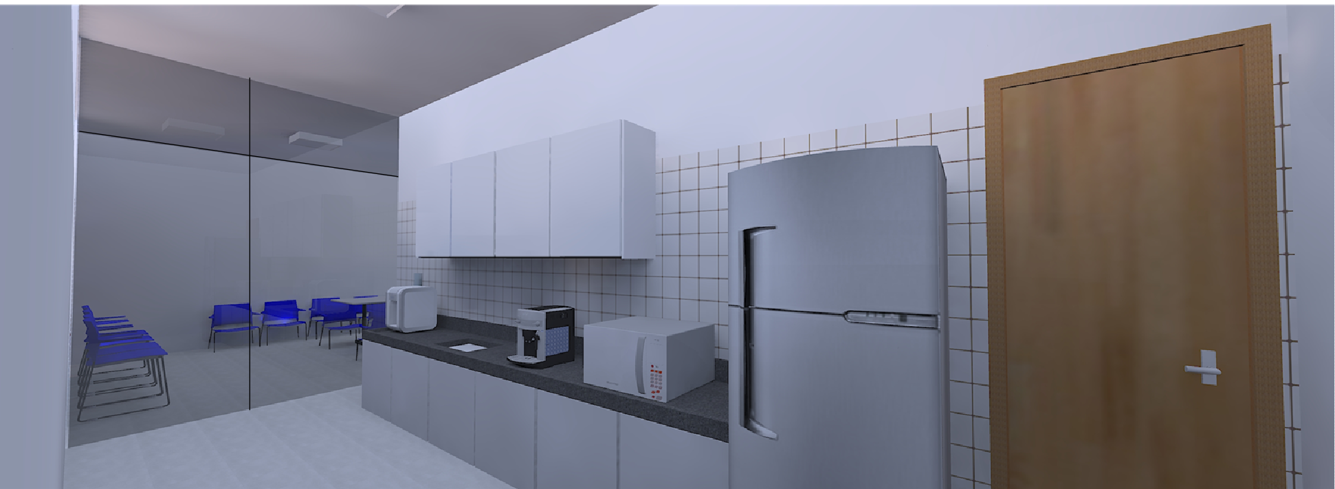
VISTA DO CAFÉ