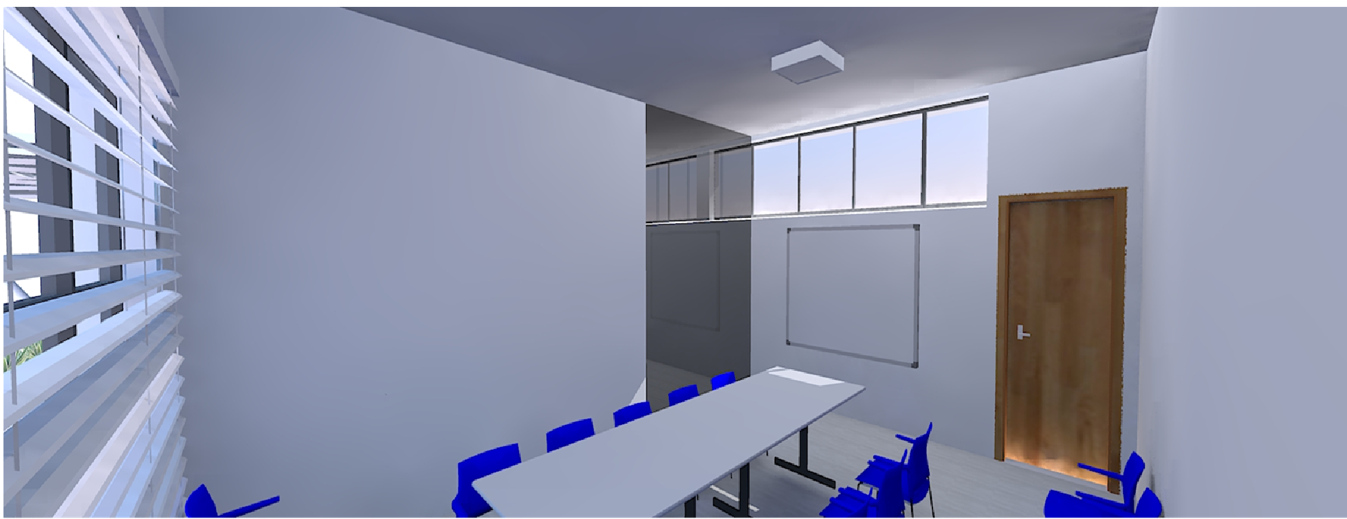
VISTA DA SALA DE REUNIÃO