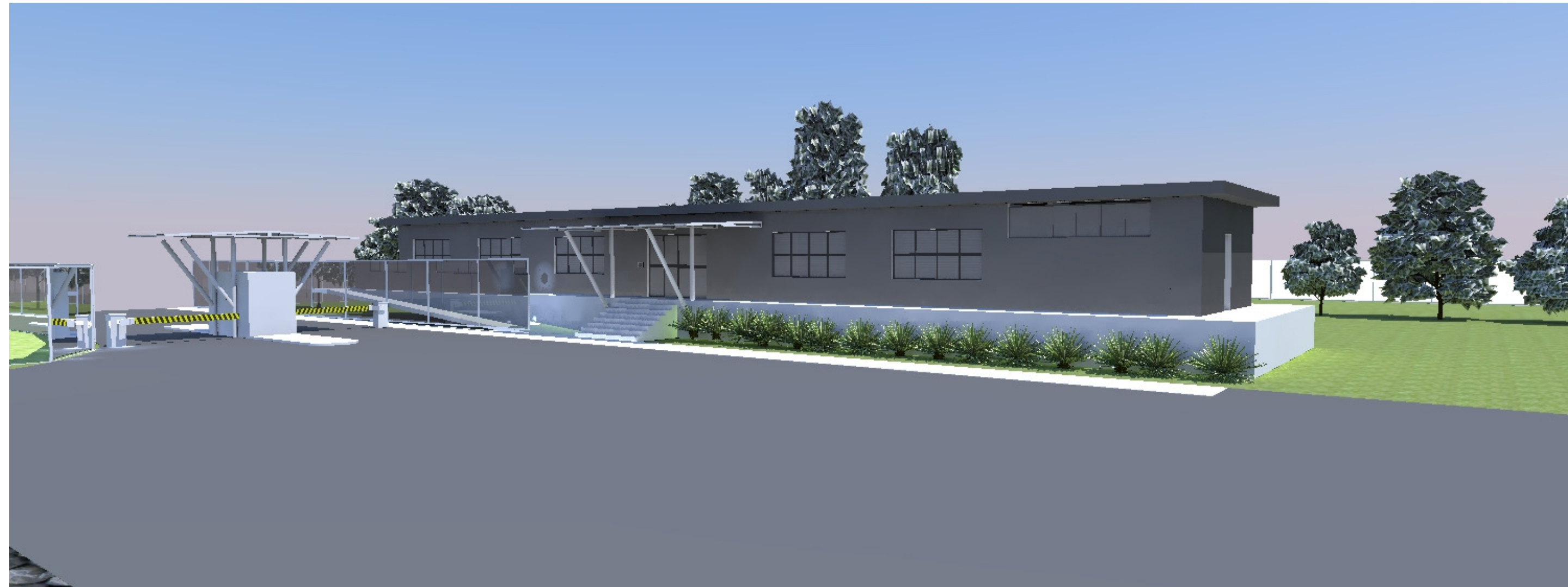
VISTA DA FACHADA