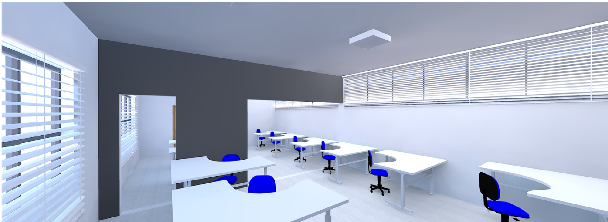
VISTA DA SALA DA CHEFIA E ADMINISTRAÇÃO