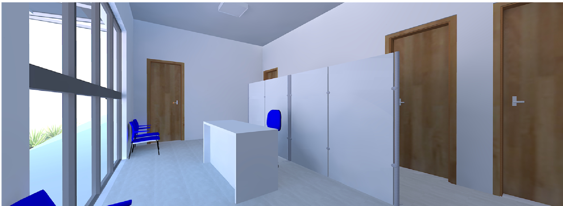
VISTA DA RECEPÇÃO