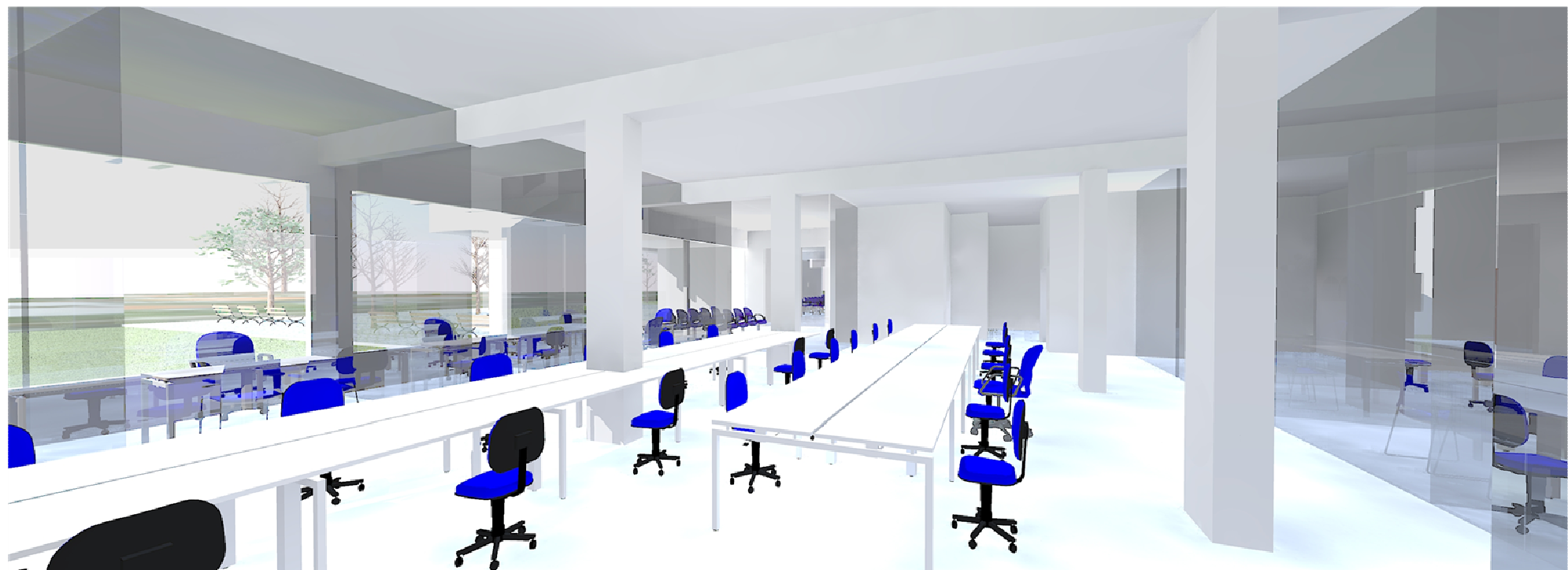
VISTA DA SECRETARIA DA FAZENDA E ADMINISTRAÇÃO

NOTA: 1- CONFERIR MEDIDAS NA OBRA 2- COTAS EM METROS 3- COTAS DE NÍVEL EM METROS 4-AS DIVISÓRIAS ARTICULADAS SERÃO SUSPENSAS PELA ESTRUTURA METÁLICA E PESAM APROXIMADAMENTE 55,00 kg/m²