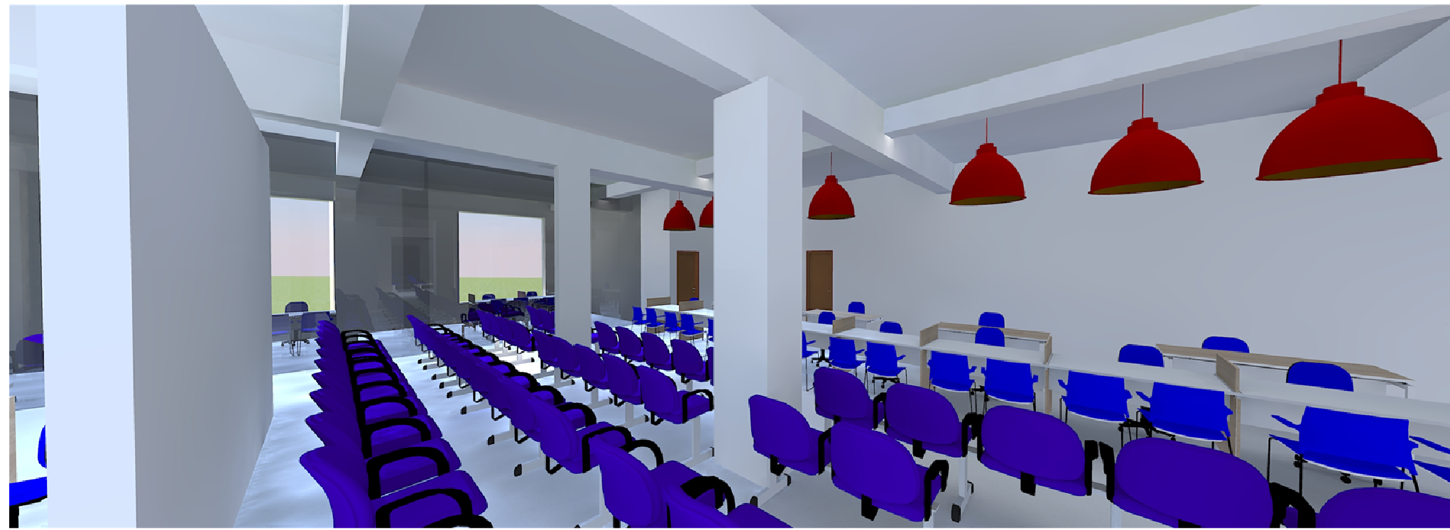
VISTA DO ATENDIMENTO ÚNICO