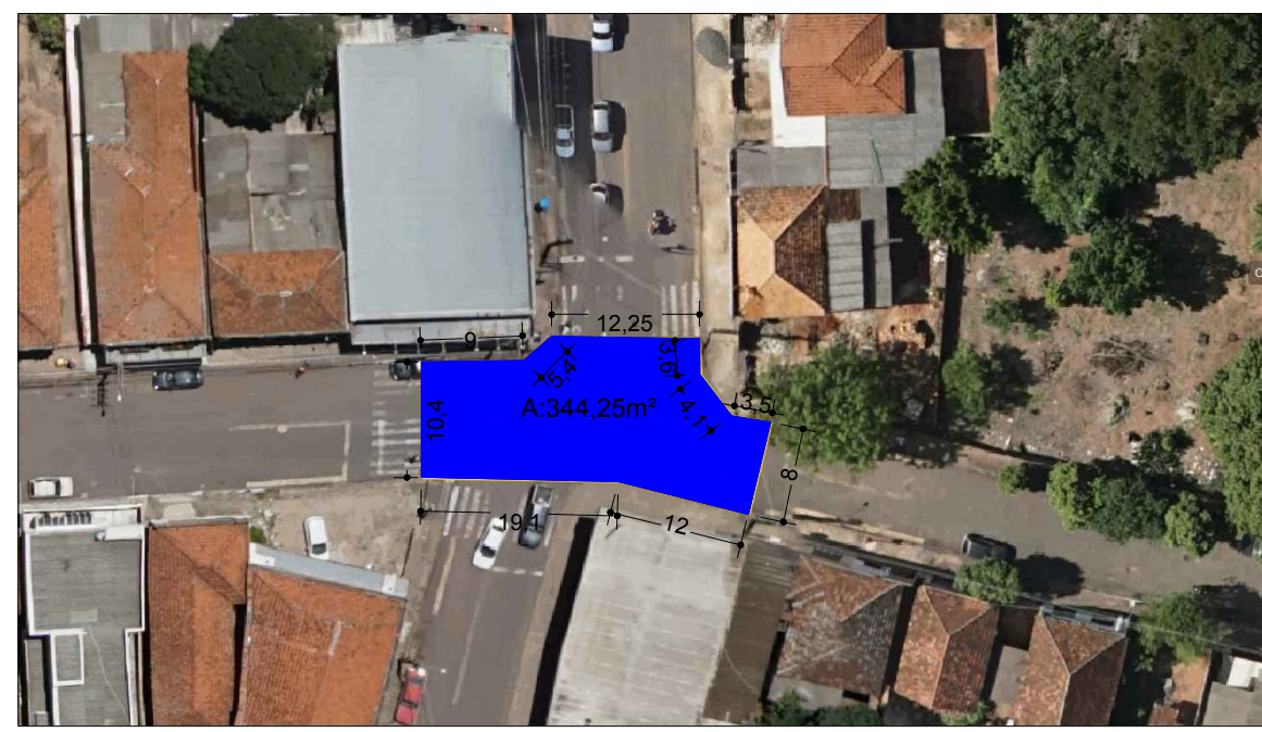
TRECHO 3 Detalhamento 01 - Sem Escala