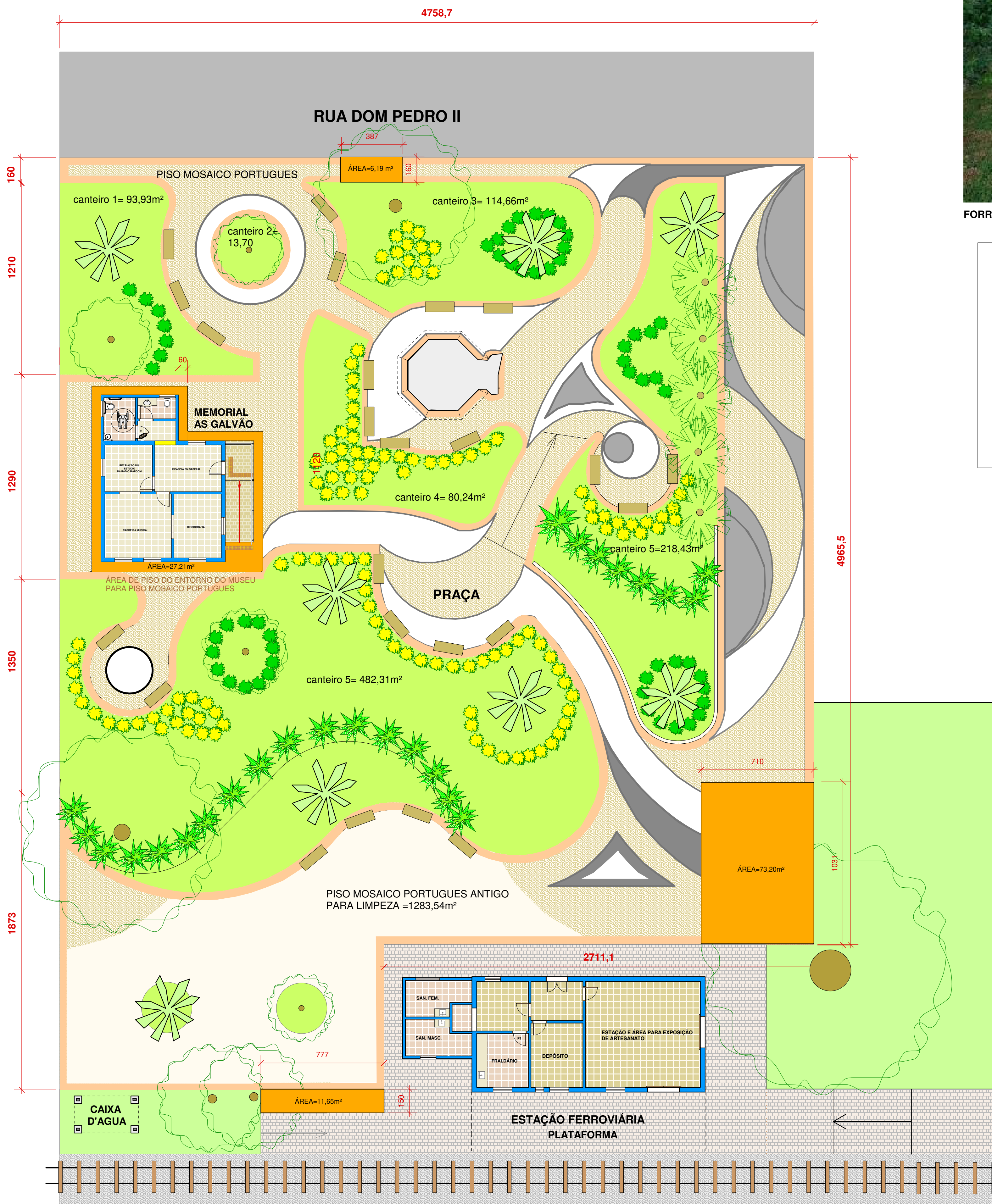
IMPLANTAÇÃO GERAL- ESC. 1: 200