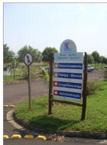
PLACA INFORMATIVA EXISTENTE ( ADOTADA PARA SINALIZAÇÃO GERAL DO PARQUE)

Arq. Renato Alves Botelho CAU/SP A68216-0