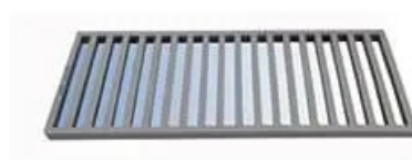
exemplo de grelha

Grelha de ferro p/canaletas(espacamento entre faces = 1,5cm - nbr 9050 acessibilidade)