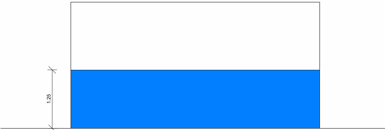
PAREDE COM BARRADO SEM REVESTIMENTO