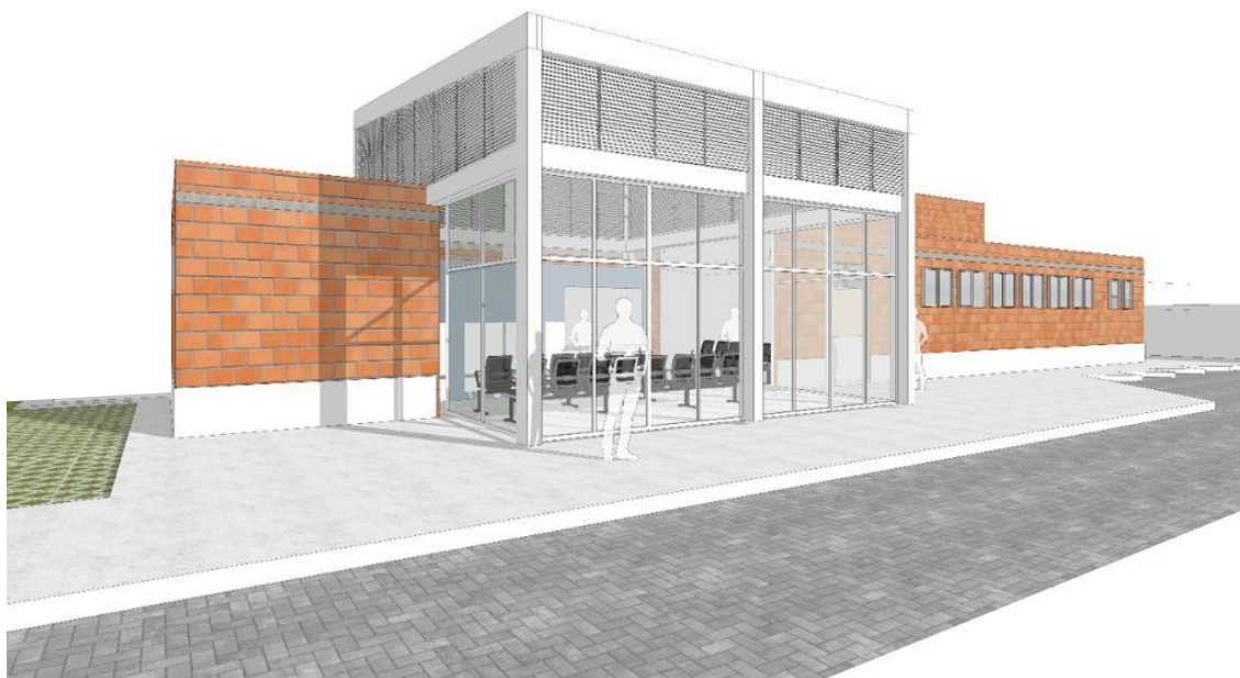
figura04 – Perspectiva