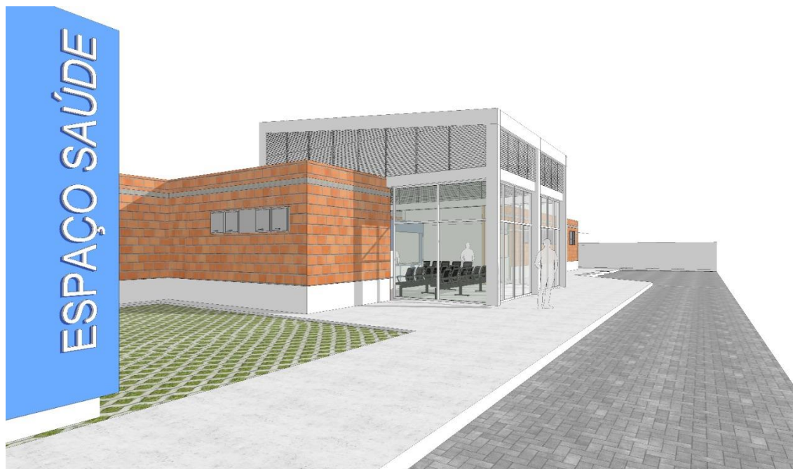
figura02 – Perspectiva