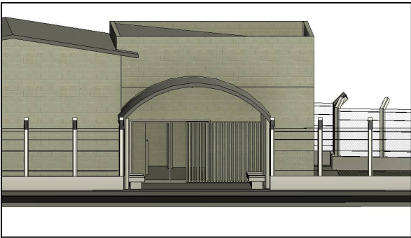
PERSPECTIVA 2 SEM ESCALA