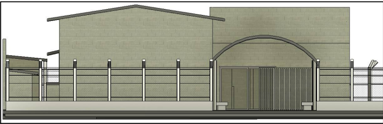
FACHADA SEM ESCALA