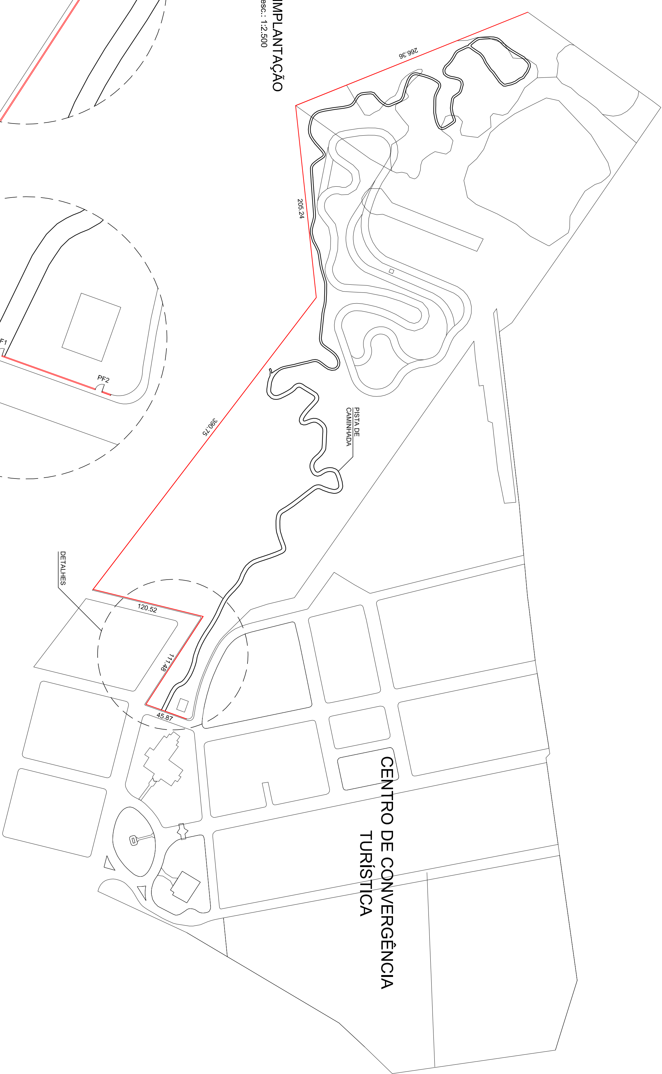
IMPLANTAÇÃO esc.: 1:2.500