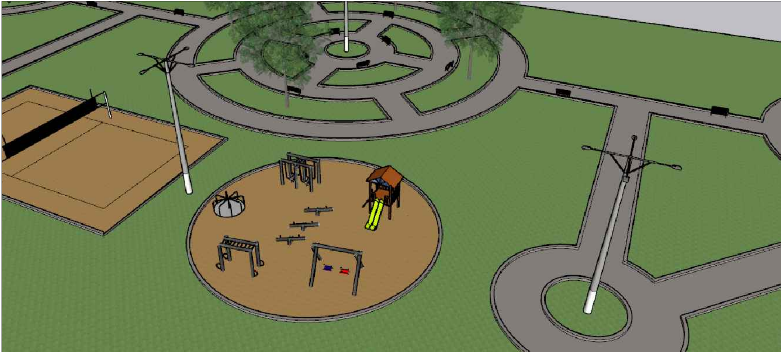
DETALHES DA PRAÇA SEM ESCALA