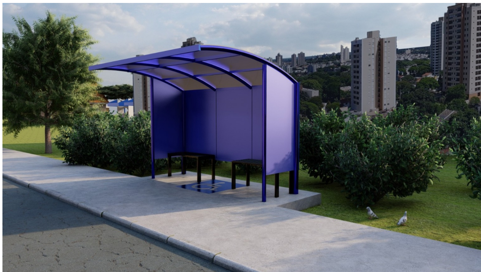
PERSPECTIVA DO ABRIGO

ARQUITETO– MARCO ANTONIO MARTINS CAU/SP: A189485-4